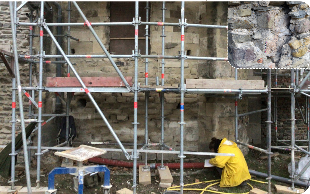
Fig. 7 : Mur ancien englobé dans la construction de l'église romane. - Fig. 8 : Relevé et étude archéologique de l'abside en cours.

Opération d'archéologie du bâti conduite entre novembre 2020 et décembre 2021 sur la commune de Ternay, en accompagnement du chantier de restauration de l'église Saint-Mayol.