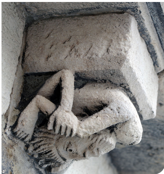
Fig. 3 : Modillon sculpté de l'abside, représentant un acrobate.

L'église Saint-Mayol appartient à un ensemble prieural dépendant de l'abbaye de Cluny (fig.2). La fondation de cet établissement à Ternay remonte, d'après les sources écrites, à la deuxième moitié du x^e siècle au plus tard. L'église, quant à elle, présente des caractéristiques esthétiques qui permettent de placer sa construction au xI^e ou au xII^e siècle (fig.3). La manière dont s'est déroulé ce chantier au Moyen Âge, l'identification des matériaux et des outils utilisés par les bâtisseurs, la restitution des élévations originelles de l'église, sont autant de questions auxquelles l'équipe d'Archeodunum a tenté de répondre.