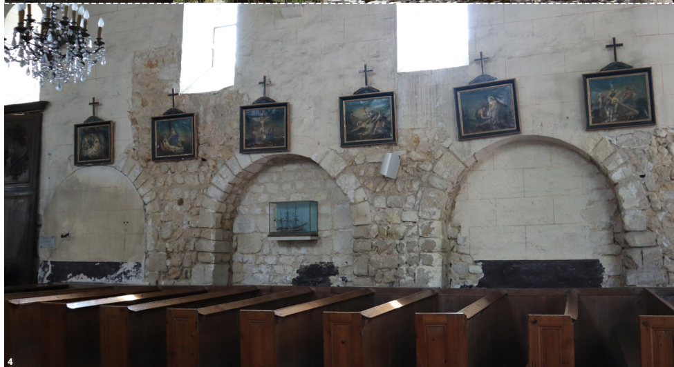
Fig.3 : Façade sud de l'église, avec les arcades romanes bien visibles dans la partie centrale du monument. - Fig.4 : Les arcades sont également bien conservées à l'intérieur de l'église.- Fig.5 : Prélèvement de mortier pour des datations au carbone 14.