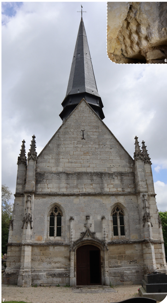
Fig. 6 : Un bloc orné d'un damier sculpté décorait une arcade romane.- Fig. 7 : Vue de la façade ouest de l'église.

Cette étude s'inscrit dans le projet de restauration, qui en est à ses débuts : en intégrant les résultats archéologiques, l'architecte Marie Caron et son cabinet vont maintenant élaborer le projet en lui-même. En fonction des travaux envisagés, des études archéologiques complémentaires pourraient venir enrichir le dossier de l'église de Sahurs dans les prochaines années.